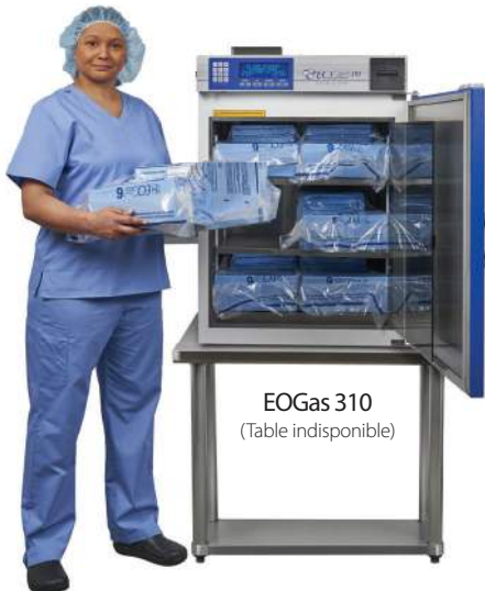
EOGas 310 (Table indisponible)